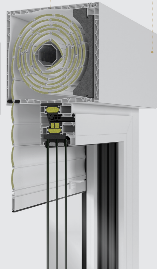
STRUGAL SC LINE 200