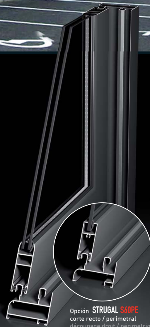
Opción STRUGAL S60PE corte recto / perimetral découpage droit / périmétrique